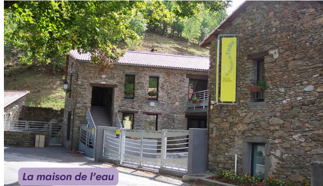
La maison de l'eau