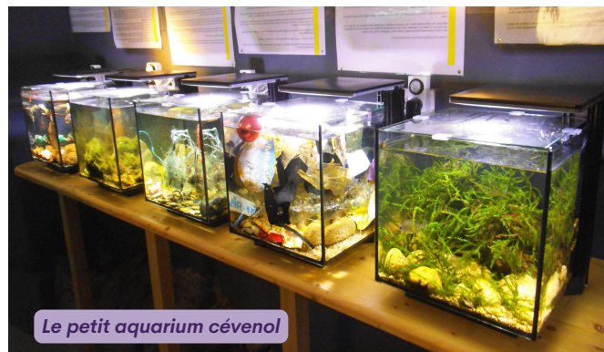
Le petit aquarium cévenol